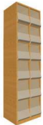
Bild rechts: Zeitschriftenschränk B600xT440xH2070 mm mit 12 Fächer, 2 Fächer neben- und 6 Fächer übereinander Art.-Nr.: SOZSS12ZK

Zeitschriftenschränk B900xT440xH2070 mm mit 18 Fächer, 3 Fächer neben- und 6 Fächer übereinander Art.-Nr.: SOZSS18ZK