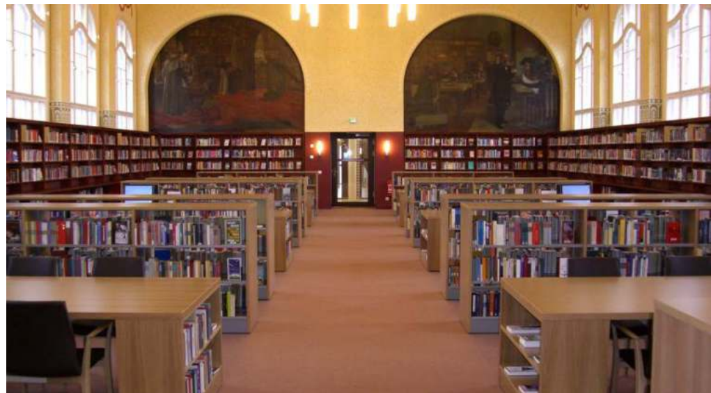
neueste Referenz von Bibliothekseinrichtung Lenk GmbH: der Lesesaal der Stadtbibliothek Görlitz

Nominiert für Großer Preis des MITTELSTANDES