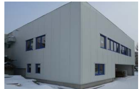
2.Anbau 2008/2009 zweigeschossig für die Erweiterung im Holzmöbelbau und Stahlmöbelbau