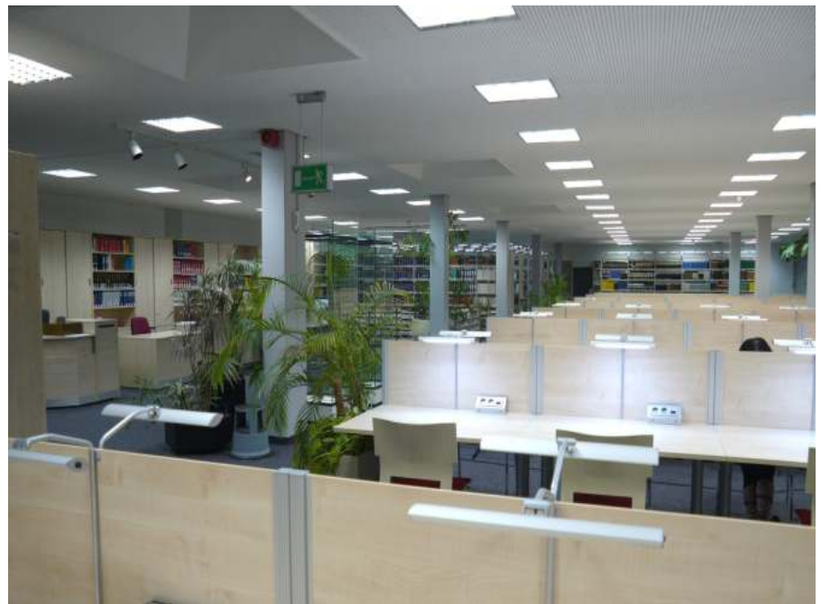
Neueinrichtung der Teilbibliothek des Juristisches Seminar der Universität Marburg

Schon in der Beratungs- und Planungsphase unterstützt die Firma Lenk mit Fachwissen aus den Bereichen Materialverwendung und Entwicklung von Bibliotheksmöbeln