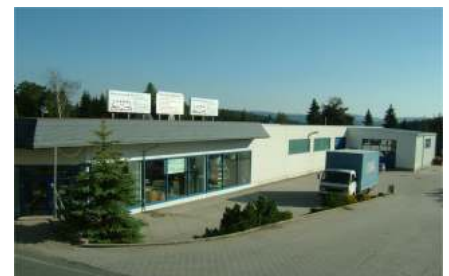
Geschäfts- und Produktionsgebäude mit 1.Anbau 2005 für die Produktion

möbel in Stahl- Holzbauweise usw. wurde direkt in die Firma Bibliothekseinrichtung Lenk verlagert.