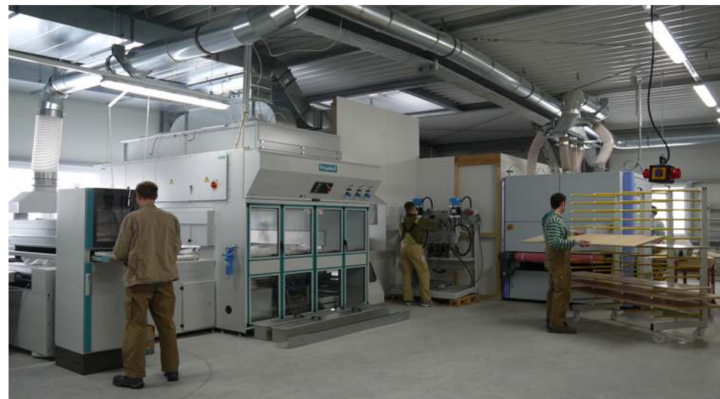
neuer Maschinenpark Schleif- und Lackiertechnik für Furnier und MDF